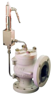
78 系列 ASME Section VIII API STD 520 - STD 526 - ISO 4126 短喷嘴 先导阀 : 突跳式和调制式 尺寸 : 1" - 8" 整定压力: 最大 431 barg 温度 : -50°C ~ +250°C 材质 : 碳钢 - 不锈钢 - 特种合金