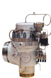
86 系列 ASME Section VIII ISO 4126 长喷嘴 先导阀 : 突跳式 尺寸 : 1" - 8" 整定压力: 最大 180 barg 温度 : 最高 550°C 材质 : 碳钢 - 合金钢 - 不锈钢