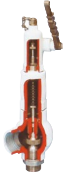
9 系列 ASME Section VIII API STD 520 - ISO 4126 长喷嘴 尺寸 : ½" - 1½" 螺纹 - 法兰 - 焊接 - 对夹 整定压力: 最大 431 barg 温度 : -196°C ~ +400°C 材质 : 碳钢 - 不锈钢 - 特种合金