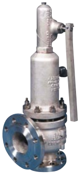
STARFLOW ASME Section VIII API STD 520 - STD 526 - ISO 4126 长喷嘴 尺寸 : 1" - 12" 整定压力: 最大 431 barg 温度 : -196°C ~ +540°C 材质 : 碳钢 - 不锈钢 - 特种合金