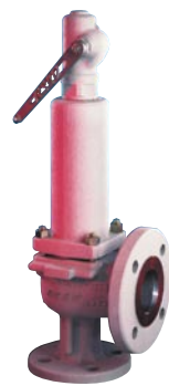
63 系列 工业用安全阀 ISO 4126 短喷嘴 尺寸 : ¾" - 10" 整定压力: 最大 50 barg 温度 : -196°C ~ +350°C 材质 : 碳钢 - 不锈钢