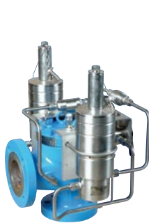
76 系列 ASME Section VIII API STD 520 - STD 526 ISO 4126 长喷嘴 先导阀 : 突跳式和调制式 尺寸 : 1" - 12" 整定压力: 最大 431 barg 温度 : -196°C ~ +345°C 材质 : 碳钢 - 不锈钢 - 特种合金