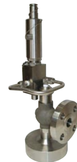
71 系列 ASME Section VIII API STD 520 - ISO 4126 长喷嘴 尺寸 : ½" - 1½" 螺纹 - 法兰 - 焊接 - 对夹 整定压力: 最大 431 barg 温度 : -50°C ~ +232°C 材质 : 碳钢 - 不锈钢 - 特种合金